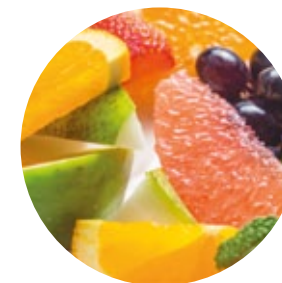
НАТУРАЛЬНЫЙ И ВОССТАНОВЛЕННЫЙ ЛИМОНАД