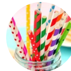
ДИЗАЙНЕРСКИЕ РАЗНОЦВЕТНЫЕ ТРУБОЧКИ