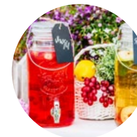
ДЕКОР ЗОНЫ БАРА